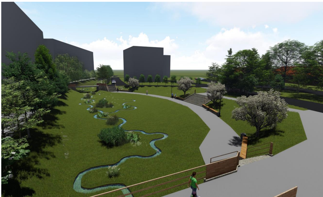
Pohledová vizualizace 6