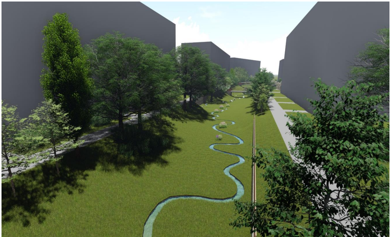
Pohledová vizualizace 2