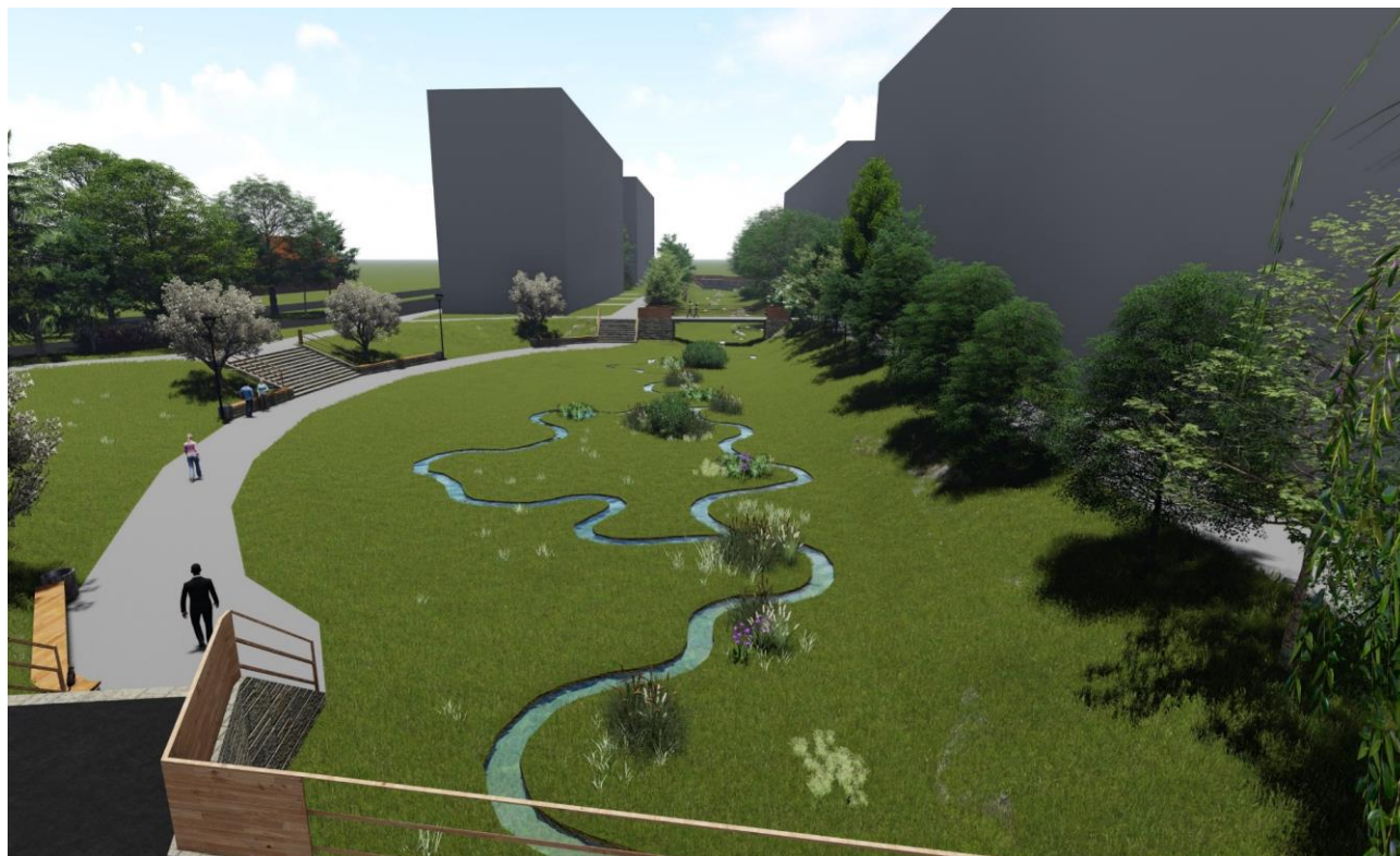
Pohledová vizualizace 7