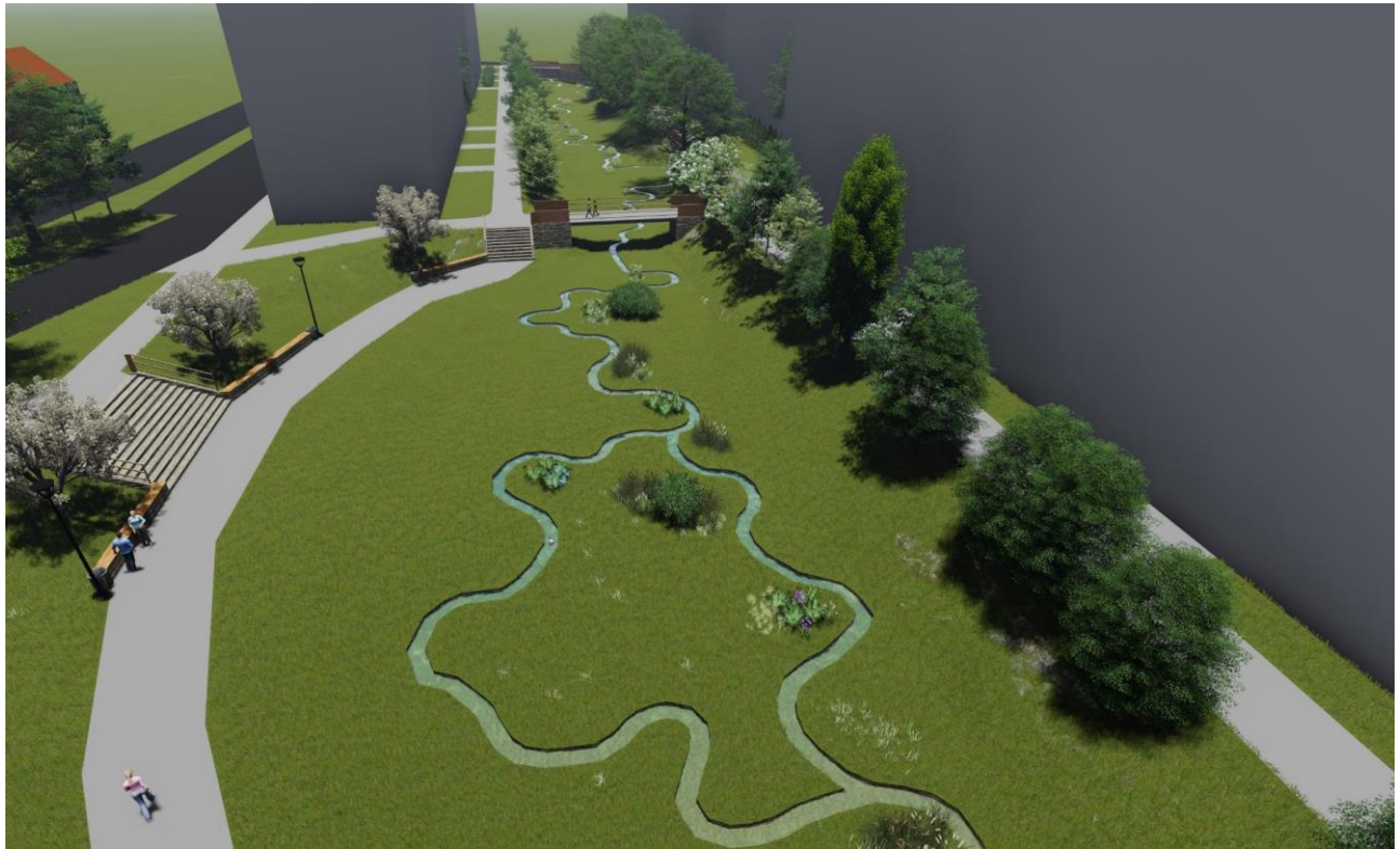
Pohledová vizualizace 1