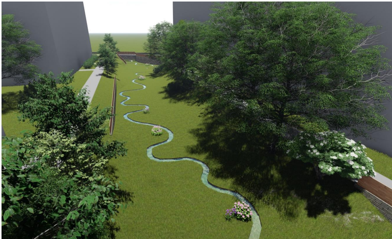
Pohledová vizualizace 5