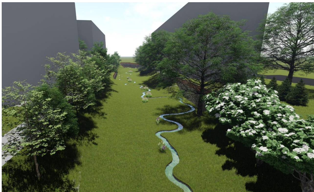
Pohledová vizualizace 4