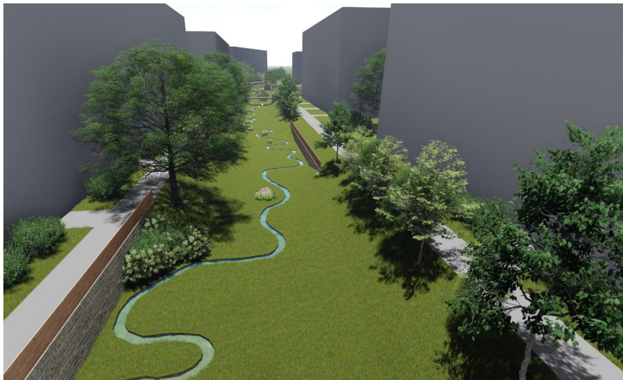
Pohledová vizualizace 3